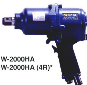
NW-2000HA NW-2000HA (4R)*