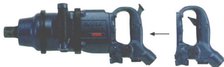
NW-4300GA NW-4300GA (6P)*