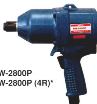
NW-2800P NW-2800P (4R)*