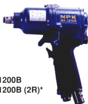
NW-1200B NW-1200B (2R)*