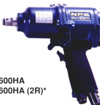
NW-1600HA NW-1600HA (2R)*